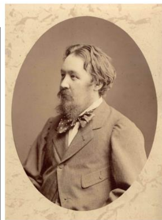
Konkoly Thege Miklós (1842-1916).